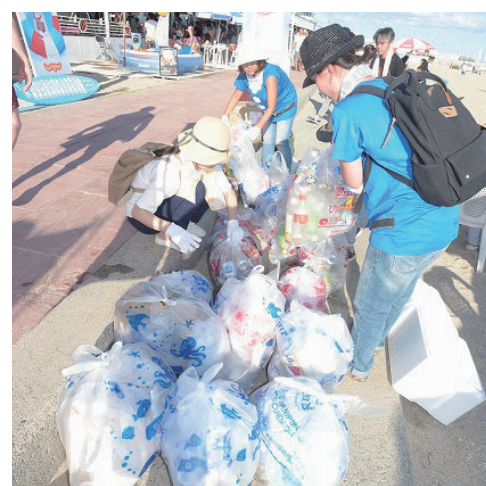
海をキレイにしよう