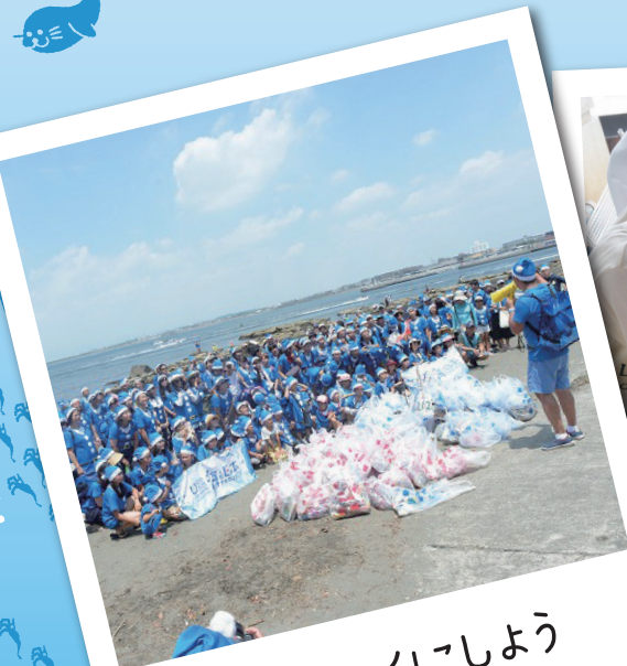
海をキレイにしよう